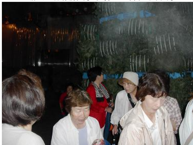
マイナス3度の熊笹保管庫。