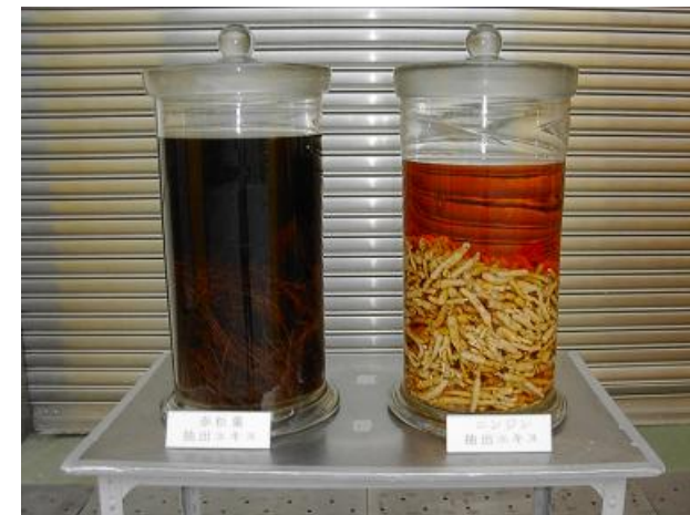
赤松葉エキスと朝鮮人参エキス抽出見本。