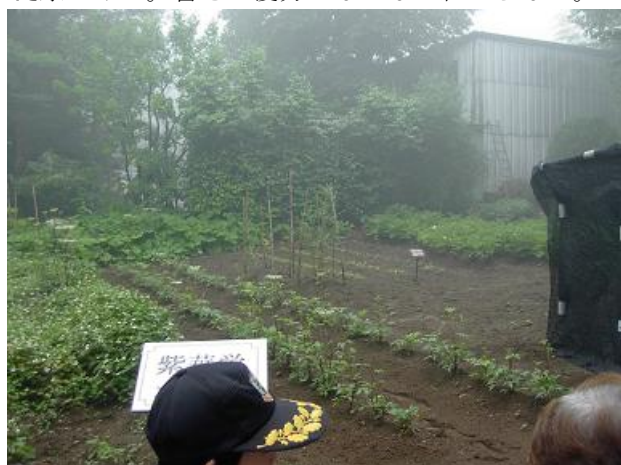
自然薬の原料。地元農家に委託して生産している。