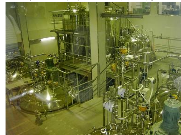
松寿仙調製室。左奥が葉緑素抽出装置。