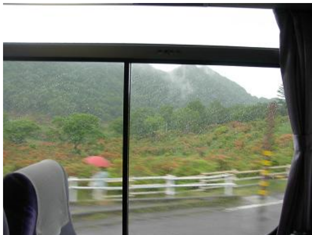
霧の切れ間でレンゲツツジが満開！