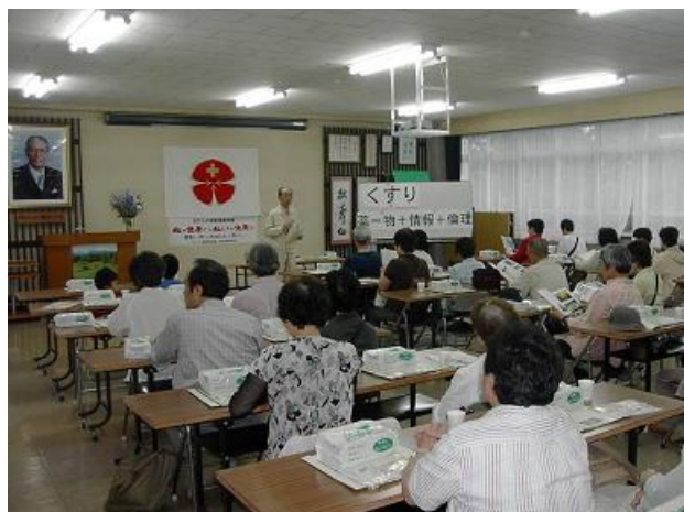
松寿仙の歴史と薬事制度の勉強。