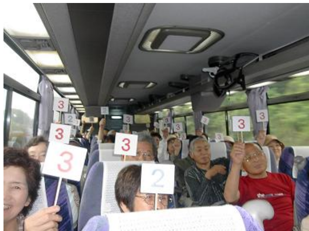
健康クイズ。皆さん優秀でなかなか終わらない。